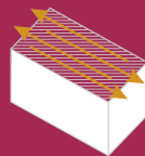
SPIANATURA FACE MILLING